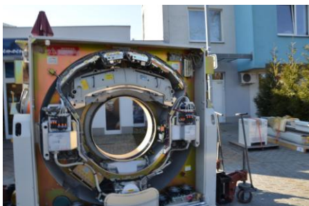
Demontáž původního CT

Na CT vyšetření se může pacient na základě předchozího doporučení objednat na tel. č.: 483 345 854 nebo osobně na recepci RTG pracoviště. Pokud se nejedná o akutní případ, jsou objednávací lhůty průměrně dva týdny.